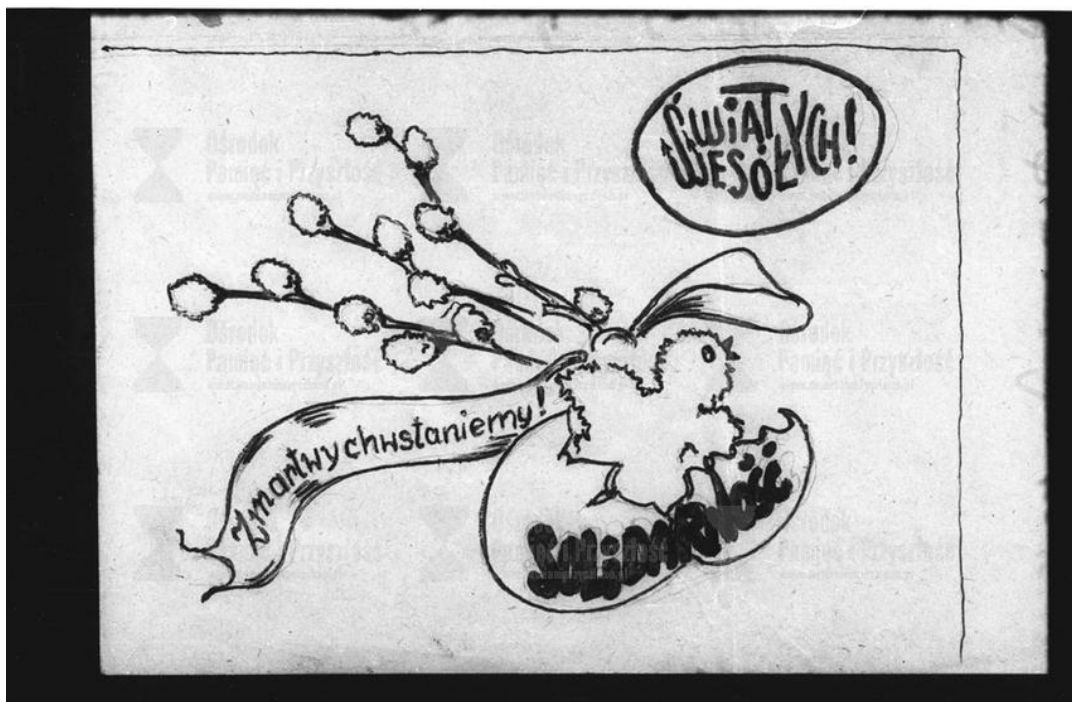
Grafika więzienna: syg. FDEM – 3052 [w:] http://archiwum.zajezdnia.org/indexpro.php