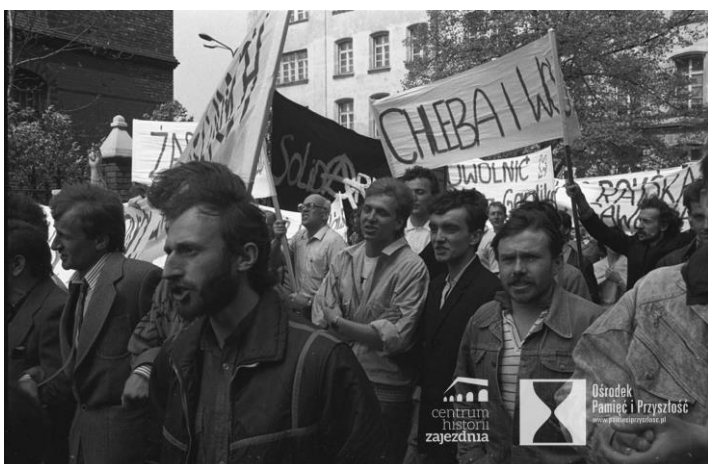
Wrocław, 1 maja 1988 roku. Plac przed kościołem św. Stanisława, św. Doroty i św. Wacława. Manifestacja z okazji święta ludzi pracy zorganizowana przez opozycję, min.: Solidarność, Niezależne Zrzeszenie Studentów i Ruch Wolność i Pokój. Demonstracja została zablokowana przez oddziały ZOMO, które zmusiły demonstrantów do schronienia się we wnętrzu kościoła.