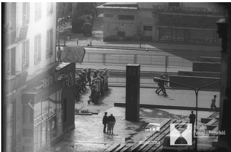
Wrocław 1 maja 1983 roku, ul Świdnicka, demonstracja „Solidarności”, walki demonstrantów z milicją i ZOMO

Pod zegarem na ul Świdnickiej, który obecnie stoi przy CH Zajezdnia, gromadziła się młodzież zachęcona do happeningów przez Pomarańczową Alternatywę. Ruch, który powstał w latach 80. z Majorem Waldemarem Fydrychem na czele, swoją działalnością ośmieszał działania rządu komunistycznego, parodiował i obnażał absurdalność PRL w formie zabawy.