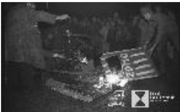
Happening Pomarańczowej Alternatywy 12.12.1988.