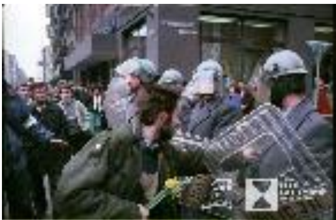
Wrocław, 22 marca 1989 roku. Marsz Wielkanocny zorganizowany przez Ruch „Wolność i Pokój”, pierwszy w Europie Wschodniej.

Na Świdnickiej 5 przy skrzyżowaniu z ul. Ofiar Oświęcimskich znajduje się tablica upamiętniająca działalność opozycyjnych rozgłośni radiowych. Stąd nadana została jedna z pierwszych niezależnych audycji radiowych. Audycje informowały o rzeczywistej sytuacji w kraju, podnosiły na duchu, informowały o uwięzionych, zapowiadały msze za ojczyznę czy kolejne manifestacje antykomunistyczne. Wcześniej zapowiadane w prasie podziemnej audycje trwały kilka minut. Zagłuszane, namierzone przez Służbę Bezpieczeństwa dostarczały Polakom niezależnych informacji.