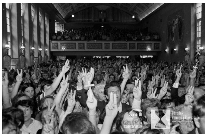
Wrocław, 26 sierpnia 1984 roku. Kościół pw. Klemensa Dworzaka przy alei Pracy, Msza św. w IV rocznicę strajków sierpniowych we Wrocławiu.