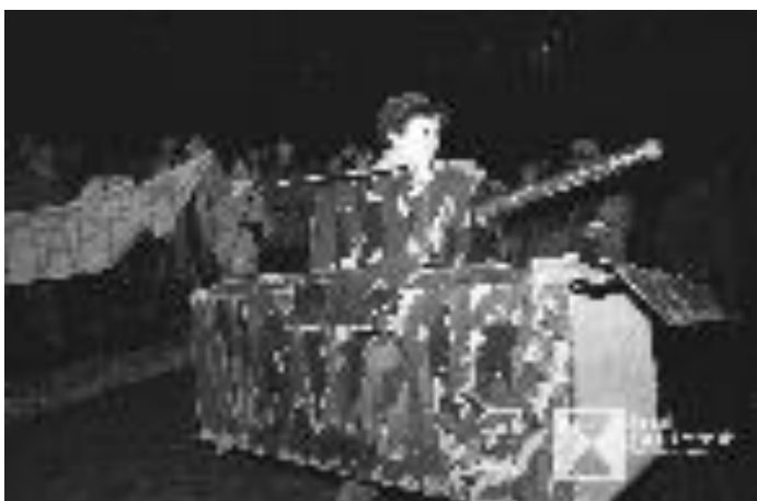
Wrocław, 12 grudnia 1988 roku. Rynek, happening Pomarańczowej Alternatywy w przeddzień rocznicy wprowadzenia stanu wojennego.