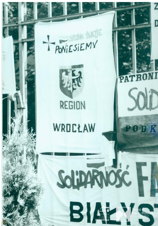
Transparenty na bramie prowadzącej na teren zajezdni autobusowej nr VIII przy ul. Grabiszyńskiej podczas strajku solidarnościowego z robotnikami z Wybrzeża.

strajkującymi i całemu społeczeństwu dolnośląskiemu. W zajezdni na Grabiszyńskiej została odprawiona po raz pierwszy msza św. Z koncertami przejeżdżali artyści – Roman Kołakowski, a nawet orkiestra Opery Wrocławskiej pod batutą Roberta Satanowskiego.