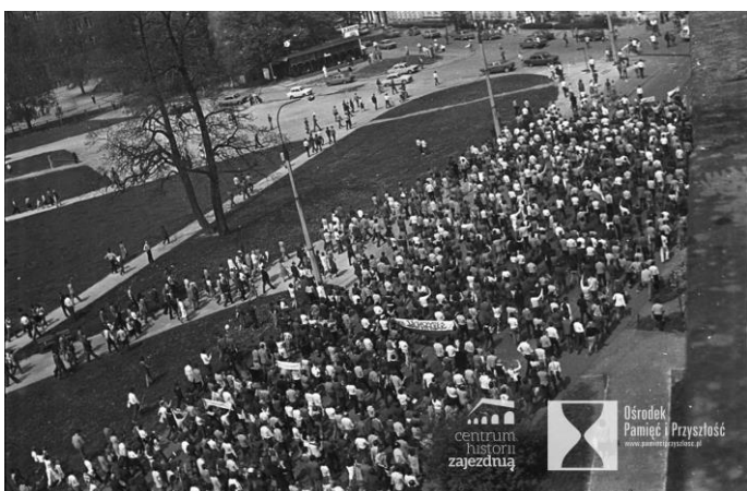
Wrocław, 1 maja 1983 roku. Pl. Grunwaldzki. Demonstracja „Solidarności” w święto 1 maja.