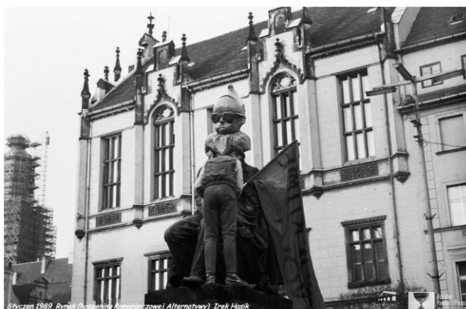
Pomnik Aleksandra Fredry na wrocławskim Rynku podczas happeningu Pomarańczowej Alternatywy, styczeń 1989.