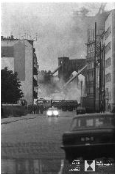
Wrocław 31 sierpnia 1982 roku, ul Mazowiecka widok w stronę most Grunwaldzki Demonstracja Solidarności walki demonstrantów z milicją i ZOMO n/z karetka pogotowia.