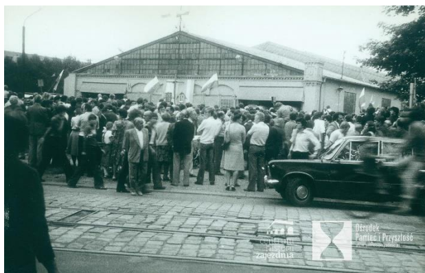
Msza św. na terenie zajezdni autobusowej nr VII przy ul. Grabiszyńskiej podczas strajku solidarnościowego z robotnikami z Wybrzeża, Sierpień 1980