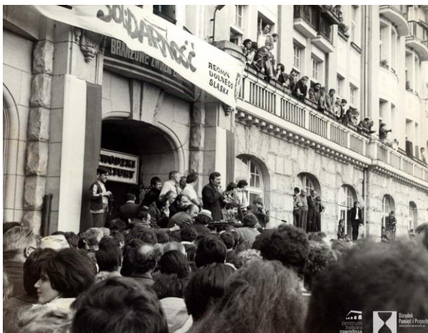
Lech Wałęsa przemawia do mieszkańców Wrocławia przed siedzibą NSZZ „Solidarność” przy ulicy Mazowieckiej. N.N.; OPIP

Po wprowadzeniu stanu wojennego, w nocy z soboty na niedzielę, oddziały ZOMO wkroczyły do siedziby Zarządu Regionu. Pomieszczenia zajmowane przez związek zostały zaplombowane i pozamykane łańcuchami. Cały teren budynku został otoczony milicyjnymi radiowozami i transporterami wojskowymi.