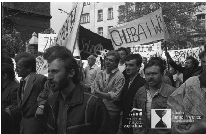
Wrocław, 1 maja 1988 roku. Plac przed kościołem św. Stanisława, św. Doroty, św. Wacława. Manifestacja z okazji święta ludzi pracy zorganizowana przez opozycję, m.in.: „Solidarność”, Niezależne Zrzeszenie Studentów i Ruch „Wolność i Pokój”.