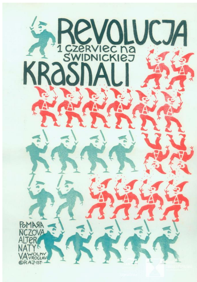
Plakat Pomarańczowej Alternatywy

Inne: Precz z U-Pałami, Rewolucja Październikowa z czołgami, z tektury i wiele innych.