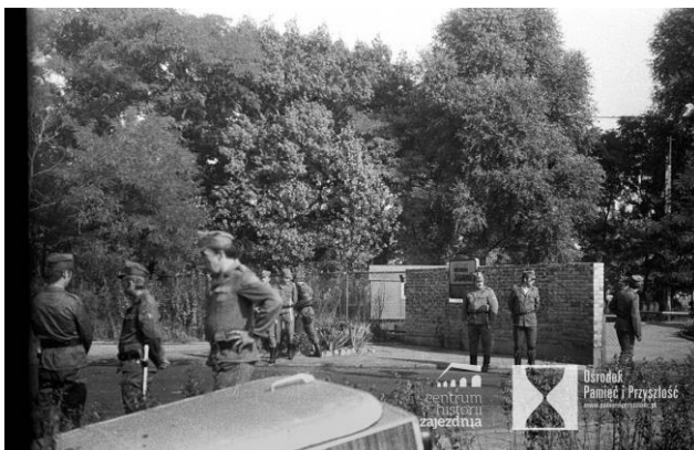
Wrocław, 31 sierpnia 1983 roku. Zajezdnia MPK przy ul. Grabiszyńskiej, tablica „Solidarność” upamiętniająca strajki i Porozumienie Sierpniowe z 1980 roku n/z patrol milicji strzegący dostępu do tablicy; 31 sierpnia 1981 roku.