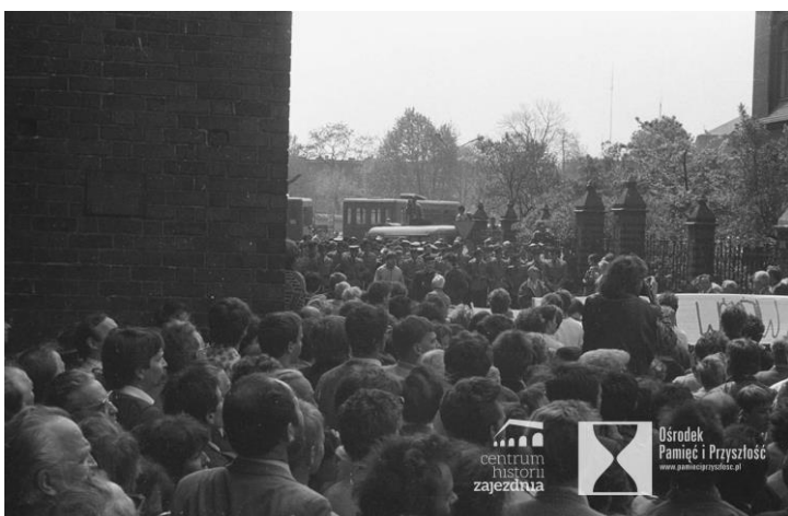
Wrocław, 1 maja 1988 roku. Plac przed kościołem św. Stanisława, św. Doroty i św. Wacława. Manifestacja z okazji święta ludzi pracy zorganizowana przez opozycję, min.: Solidarność, Niezależne Zrzeszenie Studentów i Ruch Wolność i Pokój. Demonstracja została zablokowana przez oddziały ZOMO, które zmusiły demonstrantów do schronienia się we wnętrzu kościoła.